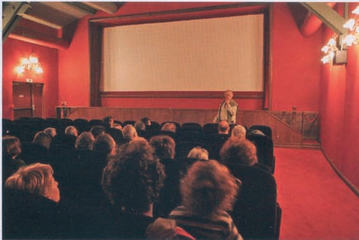
Le 10 mai dernier, au cinéma Utopia de Montpellier, lors la présentation du film « L'or vert des Incas »

Depuis bientôt un an, un mois sur deux, à l'heure où d'autres font la grasse matinée – ou se rendent à la messe –, une bonne centaine de personnes se retrouvent au cinéma Utopia de Montpellier pour un petit déj'-projection-débat autour de l'agriculture.